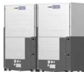
PQHY-P700YSLM-A1 PQHY-P750YSLM-A1 PQHY-P800YSLM-A1 PQHY-P850YSLM-A1 PQHY-P900YSLM-A1