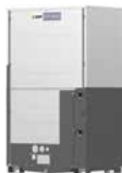
PQHY-P350YLM-A1 PQHY-P400YLM-A1 PQHY-P450YLM-A1 PQHY-P500YLM-A1 PQHY-P550YLM-A1 PQHY-P600YLM-A1