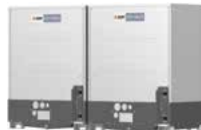
PQHY-P400YSLM-A1 PQHY-P450YSLM-A1 PQHY-P500YSLM-A1 PQHY-P550YSLM-A1 PQHY-P600YSLM-A1