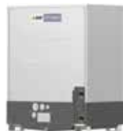
PQHY-P200YLM-A1 PQHY-P250YLM-A1 PQHY-P300YLM-A1